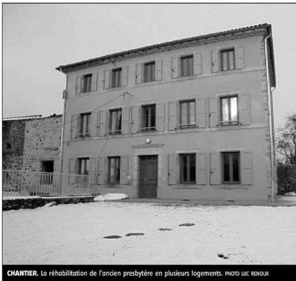
CHANTIER. La réhabilitation de l'ancien presbytère en plusieurs logements.

Et cette vie attire apparemment. L'été a été propice à la venue de nombreux visiteurs, la location des gîtes a fonctionné à plein régime. La commune passe facilement de 194 habitants en période normale à plus de 350 résidents en été. Des estivants qui aiment découvrir ce pays frontalier avec la Lozère, dominant les plateaux de la Margeride à travers les multiples chemins de randonnée et la découverte du patrimoine comme les ruines du château de Jonchères. ■